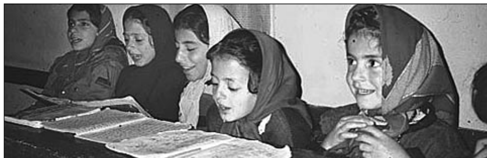
Školáci asyrských křesťanů